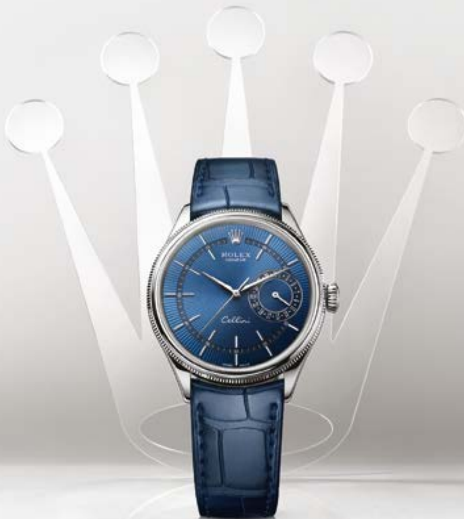
CELLINI DATE IN 18 CT WHITE GOLD

A celebração da tradição da relojoaria por excelência. A elegância de sempre com um traço contemporâneo. Mais do que contar o tempo, conta a história..