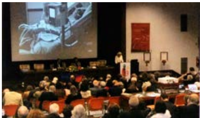
Um aspecto da assistência.