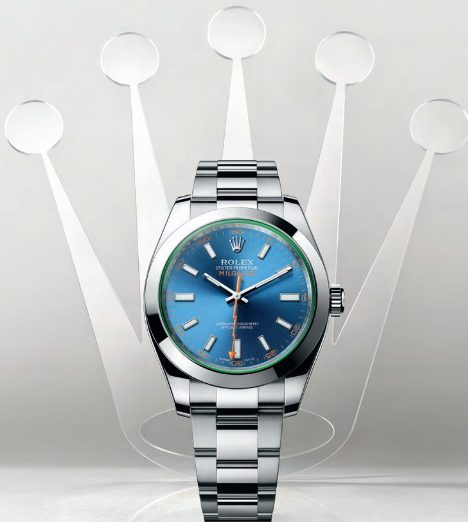
OYSTER PERPETUAL MILGAUSS

Relógio antimagnético pioneiro, desenvolvido para cientistas e engenheiros, que une um design engenhoso a um estilo irresistível. Mais do que contar o tempo, conta a história.