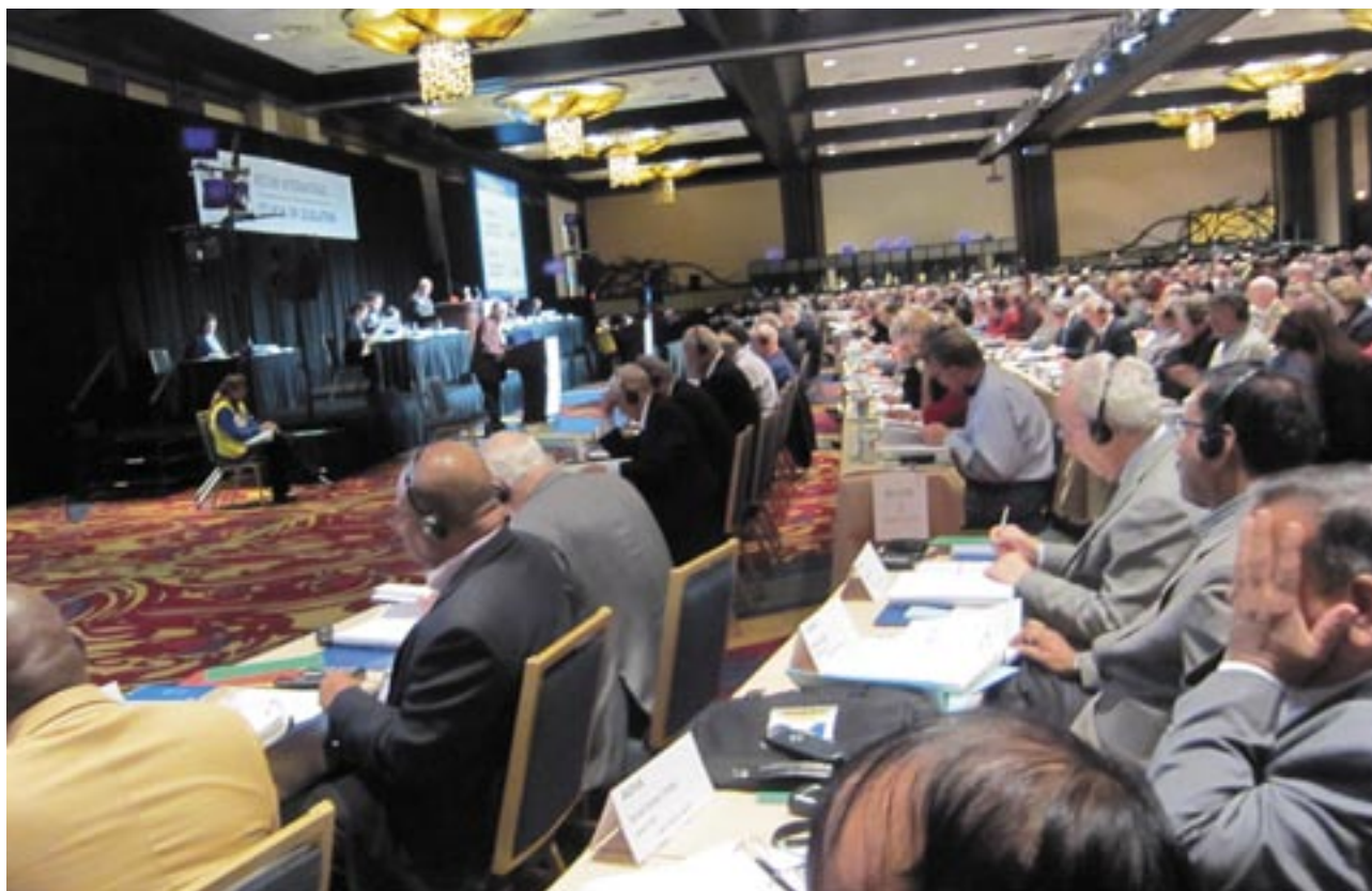
Um aspecto geral de uma das sessões de trabalho.

O Conselho de Legislação de 2013 reuniu em Chicago de 21 a 26 de Abril . Durante esse período os Delegados dos 532 Distritos Rotários tiveram a oportunidade de discutir e deliberar sobre 200 propostas de legislação apresentadas por Clubes Rotários, por Distritos e pelo Conselho Director do Rotary International.