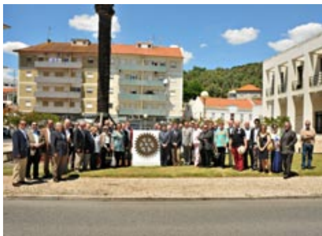
O Rotary Club de Vila Franca de Xira fez colocar em local de evidência de Alenquer um vistoso marco Rotário.

Aquando da passagem do seu 42º aniversário, o Rotary Club de Castelo Branco teve honras de direito de antena no Canal Beira Baixa TV, aí fazendo larga e profícua divulgação do Rotary e do Clube.